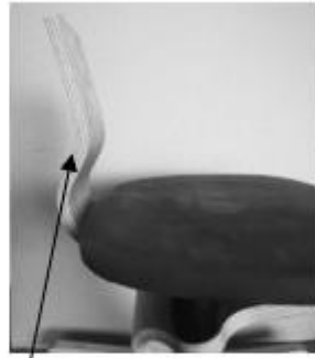
Schritt 2: Schwanenhals umdrehen und mit den drei Schrauben und der Platte wieder befestigen