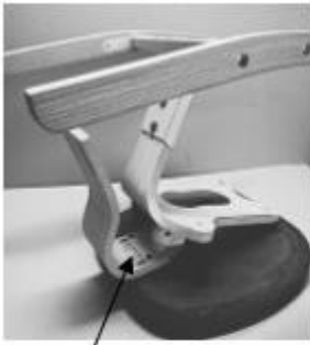
Schritt 1: Drei Schrauben lösen