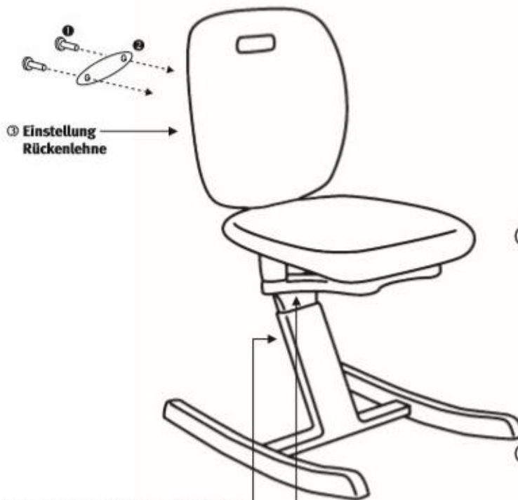
③ Einstellung Rückenlehne

1 Inbusschlüssel 4 mm 1 Inbusschlüssel 6 mm Schrauben (Abbildung nicht Originalgröße)